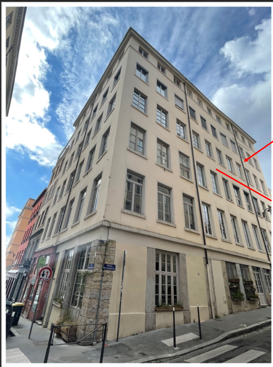
Façade immeuble et emplacement des appartements sur rue