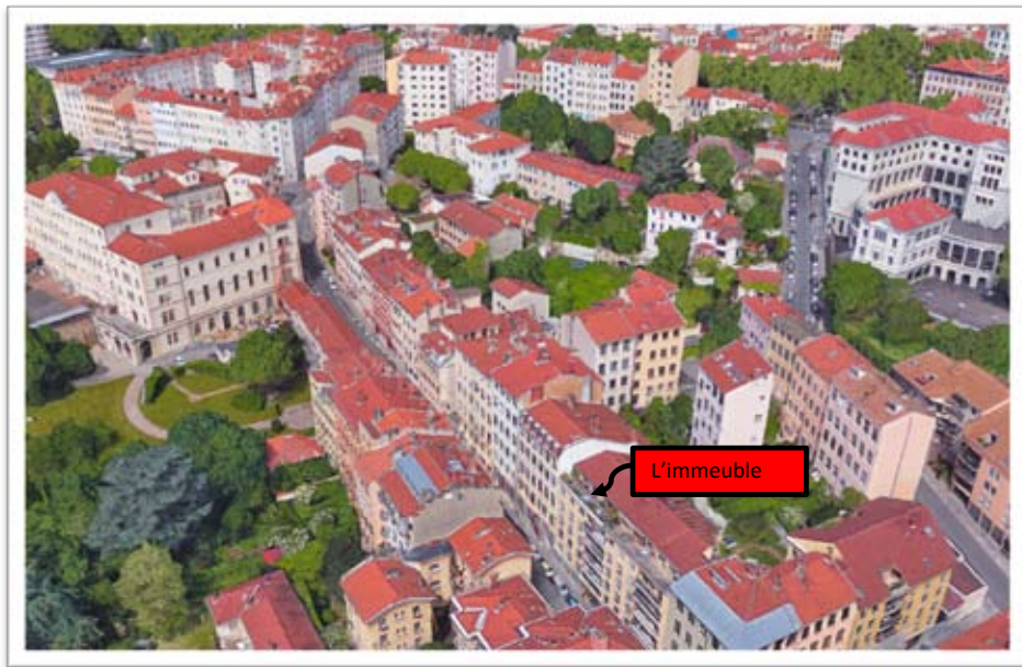
Emplacement de l'immeuble