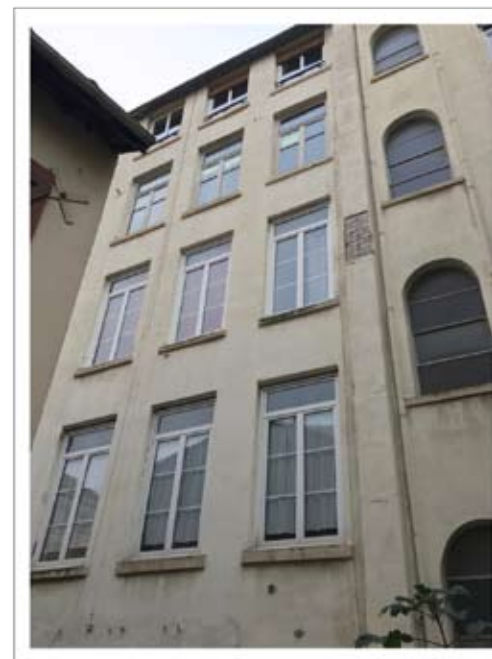
Façade de l'immeuble coté cour

La mutation de ce territoire aussi atypique qu'attachant est largement soutenue par les Collectivités locales.